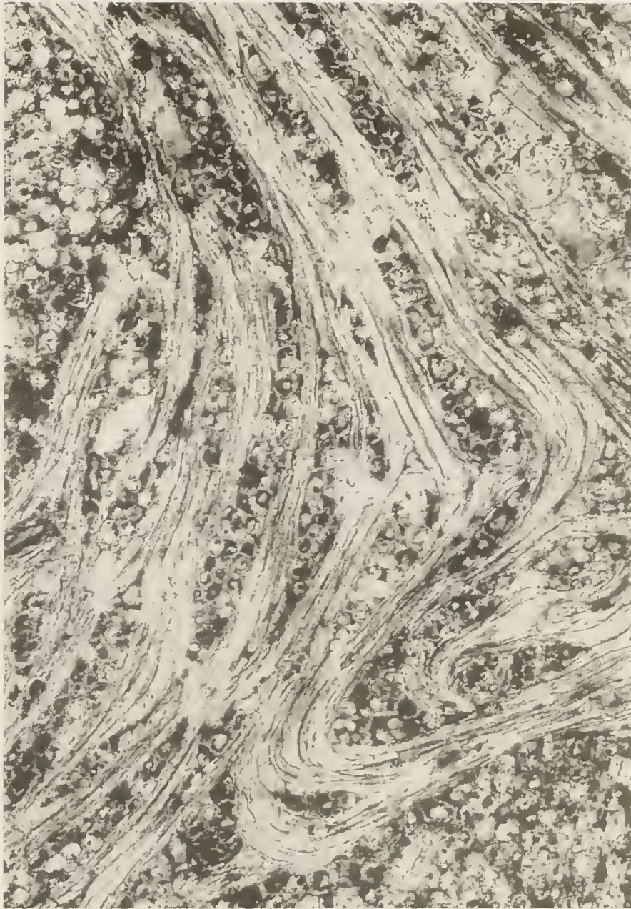
Abb 5. Cinnamomoxylon cf. limagnense – Tangentialschliff mit verquirlter Holzstruktur am Rand eines 3,4 mm großen Astansatzes; \times 120 .